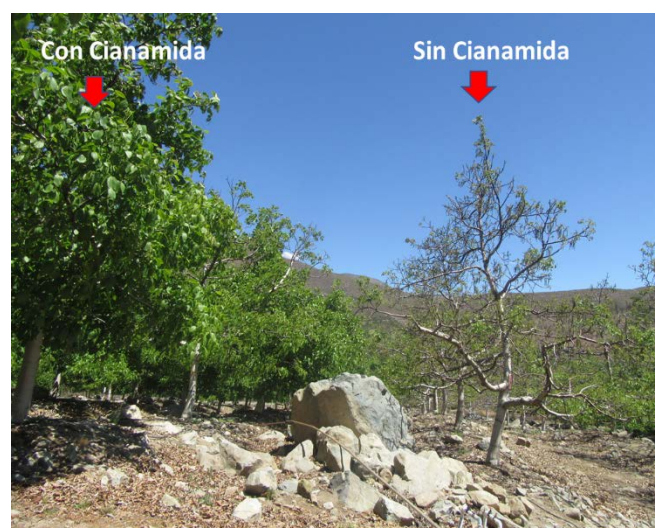
Figura 1. Huerto de nogal Serr, plantas a la izquierda con tratamiento de cianamida hidrogenada, plantas a la derecha sin aplicación

Cianamida hidrogenada se aplica entre 20 a 30 días antes de brotación, lo que significa que, para los Valles de Limarí y Choapa, sea entre el 25 de julio y el 20 de agosto para la variedad Serr y hasta el 05 de septiembre para la variedad Chanlder. Las dosis utilizadas para ambas variedades son al 2% (2 L de producto para 100 L de agua) con mojamientos entre 800 a 1.200 L/ha. En la Figura 2 , se detalla el comportamiento de la floración femenina de acuerdo al tratamiento.