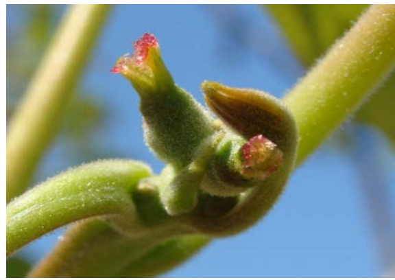
Figura 4. Inicio de receptibilidad de flor femenina.