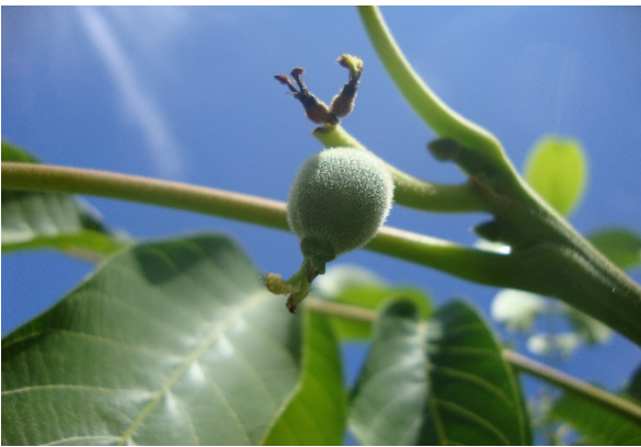
Figura 3. Flores femeninas abortadas por exceso de polen.

ReTain se aplica cuando hay entre un 10 y 20% de receptibilidad de la flor femenina ( Figura 4 ), por lo que se debe monitorear en forma constante la fenología. En estados posteriores a éste, como plena flor, no hay efecto del producto. La dosis de ReTain es de 830 g/ha, con mojamientos entre 1.000 - 1.500 L/ha. La aplicación óptima y oportuna de ReTain en nogal, permite aumentar el porcentaje de cuaja de frutos ( Figura 5 ).