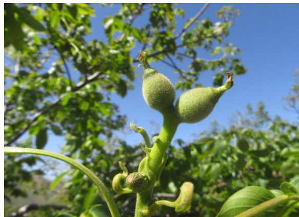
Figura 5. Fruto cuajado.

INIA más de 50 años aportando al sector agroalimentario nacional