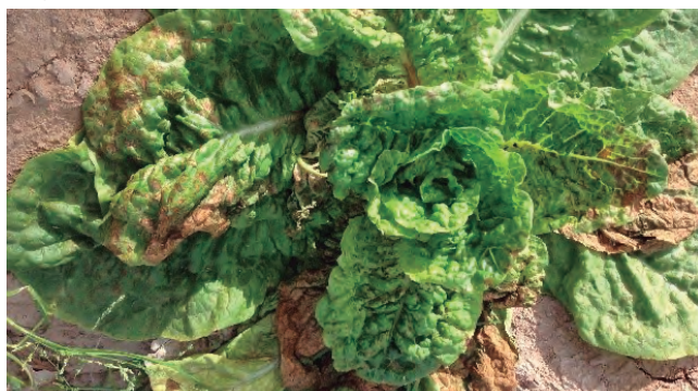
Foto 2. Lechuga mostrando síntomas de infección por INSV.

El trips de California ( Frankliniella occidentalis Pergande), se ha convertido en una plaga de suma trascendencia en el cultivo de la lechuga a nivel nacional debido a su capacidad de transmitir el Virus de la Mancha Necrótica del Impatiens (INSV por sus siglas en inglés), el cual fue reportado por primera vez para Chile durante la temporada 2013–2014 en cultivos de lechugas de la Región de Coquimbo. Desde entonces se ha diseminado rápidamente por toda la zona productora de lechugas de esta región, y recientemente ha sido detectado por los autores en la Región de Atacama, con una severidad aun mayor a la observada en la Región de Coquimbo.