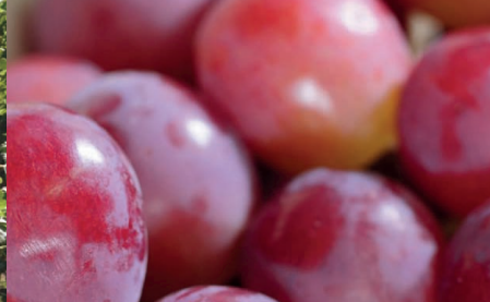
Cuadro 1. Calidad de fruta. Promedio 9 años (2003-2011).