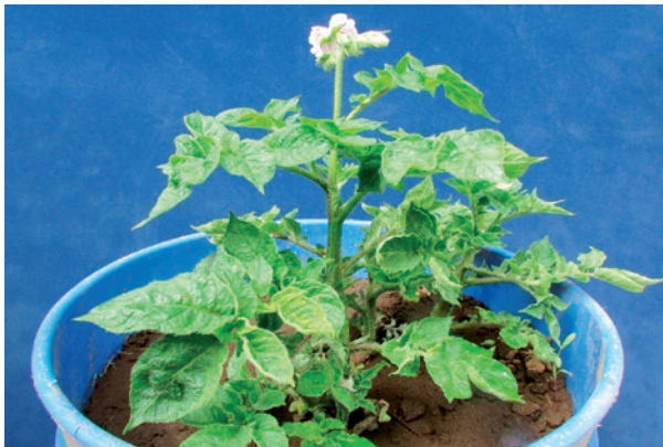
Foto 1. Síntomas foliares severos causados por PVY (deformación mosaico).

Se han descrito varias razas de este virus, las que incluyen PVY 0 (raza ordinaria o común), PVY N (raza necrótica, por la reacción que causa en hojas de tabaco, siendo en papas menos agresiva que PVY 0 ), PVY N TM (raza que causa necrosis en tabaco pero también causa manchas necróticas y anillos en los tubérculos de algunas variedades de papa) y PVY N 0 (razas recombinantes, porque tienen algunas características que comparten de las razas PVY 0 y PVY N ). Las razas de PVY pueden interactuar con otros virus de la papa como el PVX y PVA, lo cual no sólo hace más variada la sintomatología, sino que además se traduce en mayor potencial de daño.