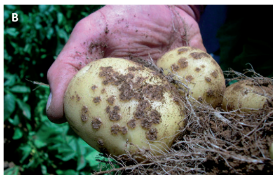
Foto 1. Sintomatología de sarna común en tubérculos de papa.

INIA más de 50 años aportando al sector agroalimentario nacional