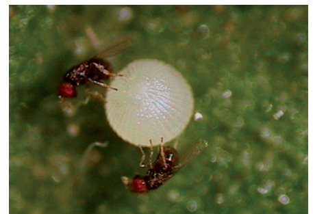
Foto 5. Huevos de H. zea con adultos de Trichogramma spp.