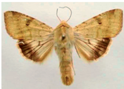
Foto 3. Adulto de gusano del choclo.

En tomate, el daño es provocado por la larva recién eclosada. Comienza con el consumo de hojas, también pueden taladrar tallos. En plena fructificación, la larva se traslada al fruto teniendo preferencia por los frutos verdes. Generalmente completan su ciclo larval en un sólo fruto al que muerden perforando superficialmente, lo que a menudo facilita la introducción de patógenos (Foto 4). Las larvas pequeñas también pueden afectar a varios frutos, perforándolos superficialmente.