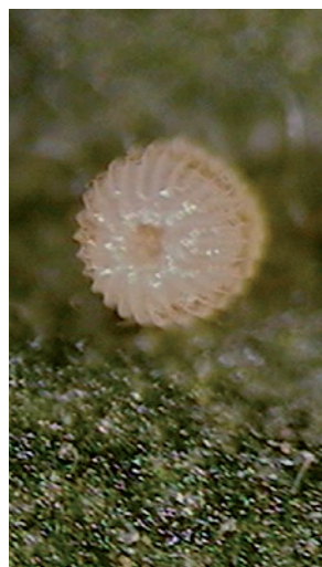
Foto 1. Huevo de gusano del choclo.