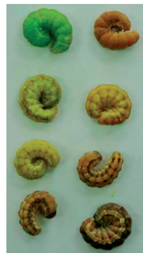
Foto 2. Larvas de gusano del choclo con diversos colores de acuerdo al hospedante.

de las larvas no es una característica que permita diferenciarlas de otras especies de gusanos cortadores. Sin embargo, la presencia de gránulos oscuros, provistos de una cerda corta en el ápice a lo largo del dorso en el esqueleto, permiten identificarla de otras especies. Cuando han adquirido su desarrollo miden entre 33 a 55 mm de largo por 6 a 7 mm de diámetro y se dejan caer al suelo donde pupan.