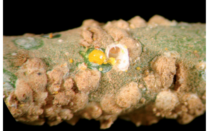
Foto 2. Hembra y huevos de H. lataniae .

El control químico ha resultado efectivo en el manejo de la plaga, sin embargo, hay que considerar factores como la oportunidad del control, debido a que debe coincidir con la mayor cantidad de ninfas migratorias para evitar su desplazamiento