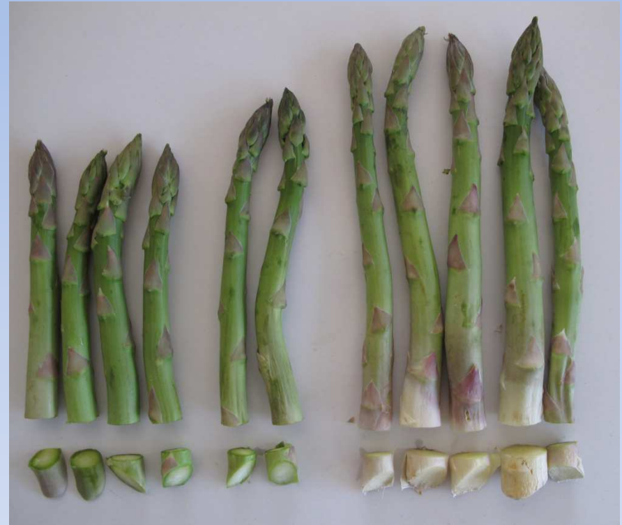
Corte a 1 o 2cm de la base

Clasificación: por calibre, calidad y longitud