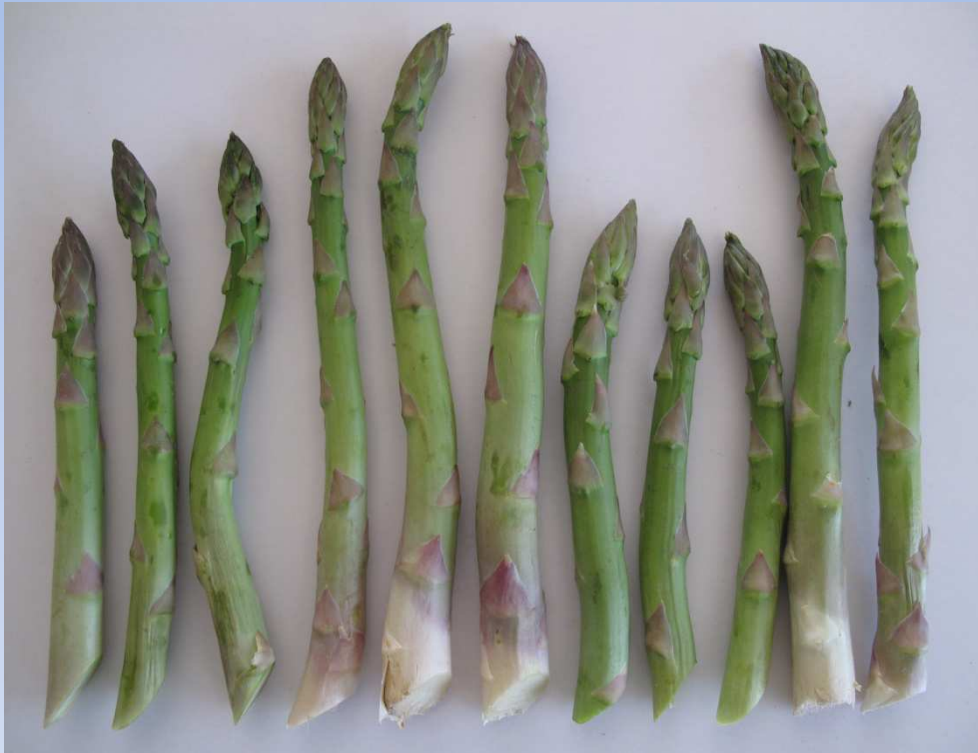
Alineación de las bases