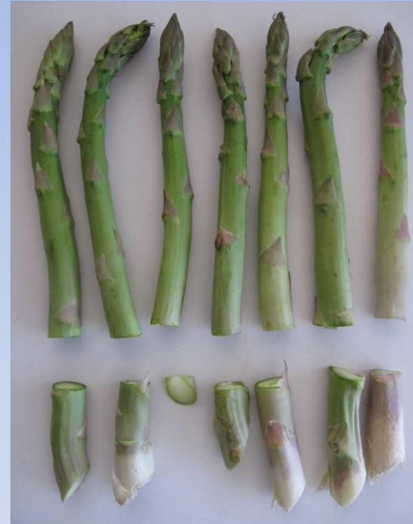
Arman los atados con las puntas juntas y cortan al más corto