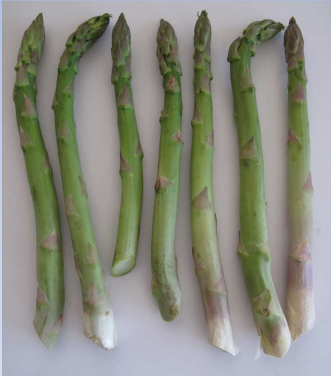
Selección por calibre y calidad