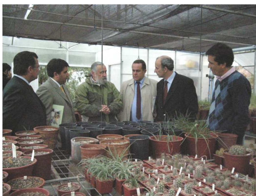
A la izquierda, el ministro, junto a las otras autoridades visitando la Unidad de Propagación de Especies Amenazadas del Banco.