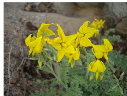
Lycopersicon sp., una de las especies de las especies buscadas por la expedición.