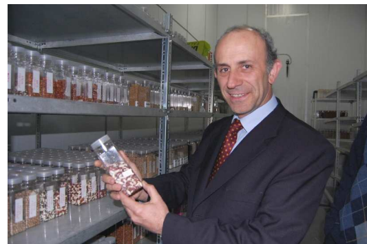
Arriba, José Antonio Galilea, Ministro de Agricultura, visitando las colecciones de semillas almacenadas en el Banco Base de Semillas.