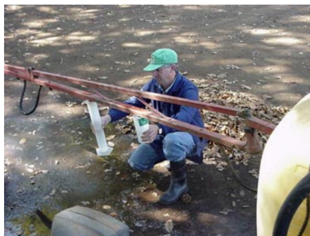
Foto 1. Medición del caudal de la boquilla en una barra pulverizadora.

Se recomienda cargar el estanque del equipo pulverizador, con agua limpia no más allá de la mitad de su capacidad, y luego poner en marcha el equipo sin pulverizar. Se agrega el plaguicida por la boca del estanque, y hecho esto se completa