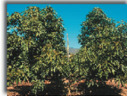
Figura 2: Sistema de conducción epsilon con dos brazos abiertos y buena iluminación.

En un capítulo del libro "The avocado: Botany, production and uses 2002", Whiley concluye que sistemas de plantación en alta densidad son