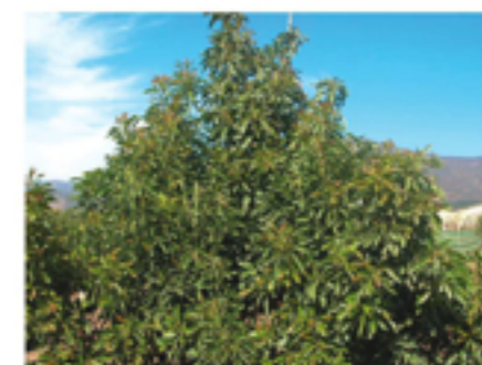
Figura 3: Sistema de conducción con eje central.

flores la siguiente primavera. Nuestro estudio muestra que es posible desarrollar brotes silépticos mediante poda, que el rebaje de estos brotes impide que este vigoroso brote deforme la estructura definida, y que luego se desarrollan muchos brotes prolépticos sobre este brote siléptico principal. Sin embargo, para que esta rama pueda producir flores en la siguiente primavera conviene que estos brotes prolépticos se desarrollen y maduren durante el verano.